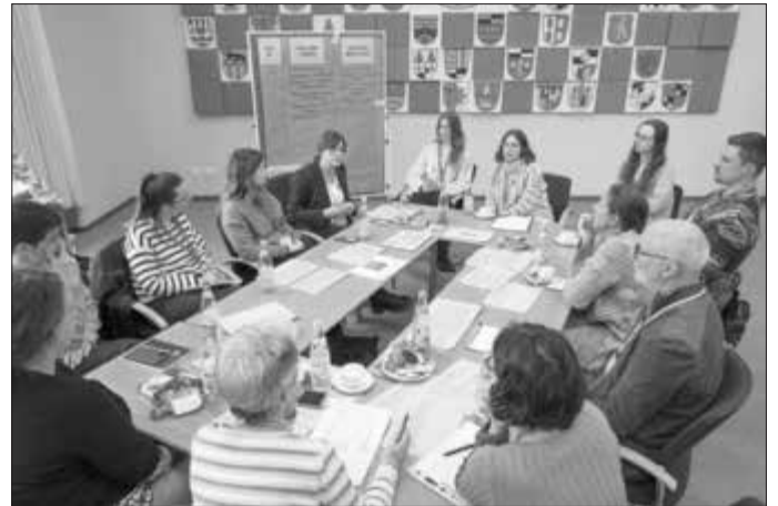
Mit der Umsetzung der Istanbul-Konvention befassten sich zahlreiche Fachkräfte bei einem Runden Tisch im Landratsamt Ansbach.

Die Bedarfsanalyse ist mit dieser Veranstaltung noch nicht abgeschlossen. Der Runde Tisch wird seine Arbeit fortsetzen und auch temporäre Unterarbeitsgruppen bilden.